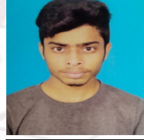
Photo and Signature